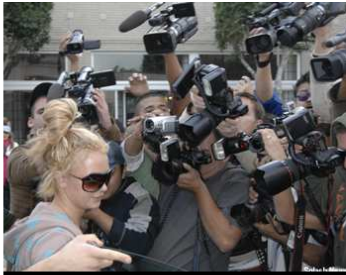
Britney Spears photographée par des paparazzis.

Les paparazzis sont des journalistes photographes qui traquent les stars.