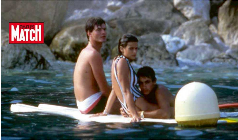
Stéphanie de Monaco et Anthony Delon, août 2010